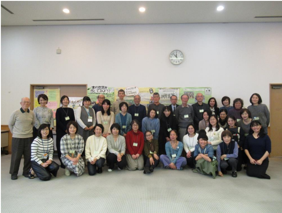
成果発表した運営委員のみなさん