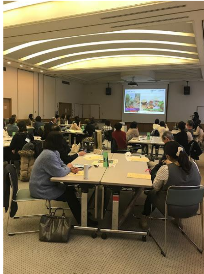
成果発表後、こまちぷらすの事例紹介とワークを行う