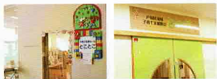
とつかの子育て応援ルーム とことこ