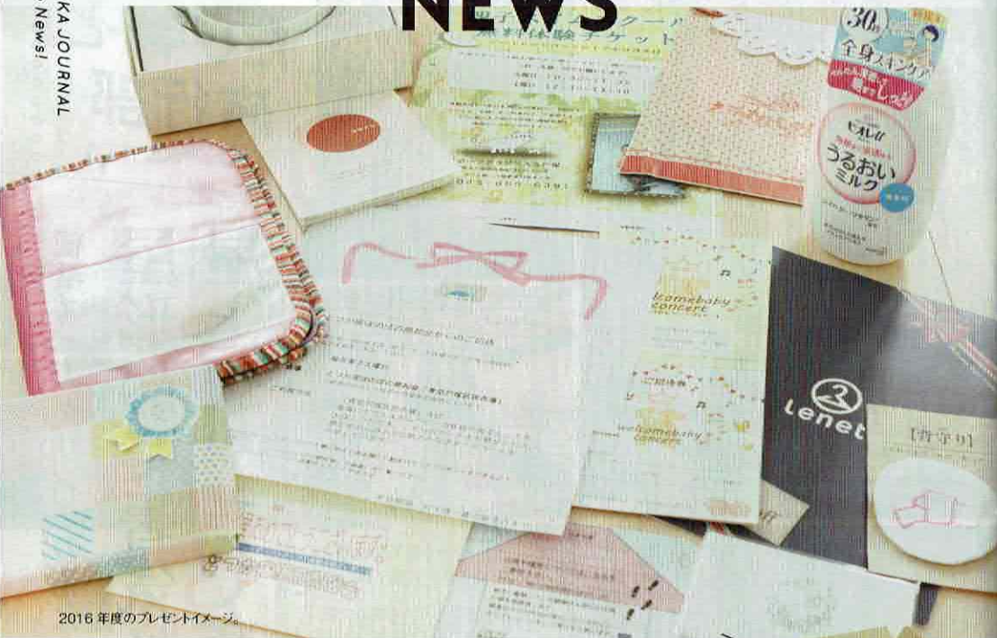
2016年度のプレゼントイメージ。