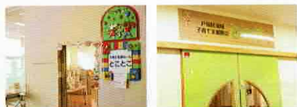
とつかの子育て応援ルーム とことこ